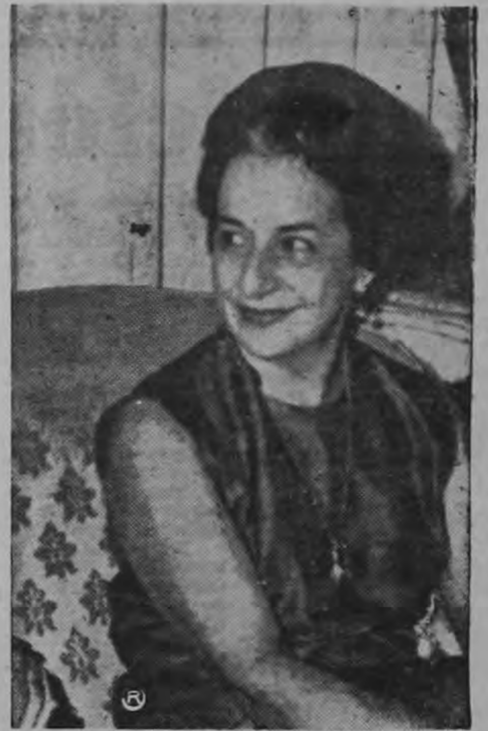
Sra. Doña MARITA DE ORLICH